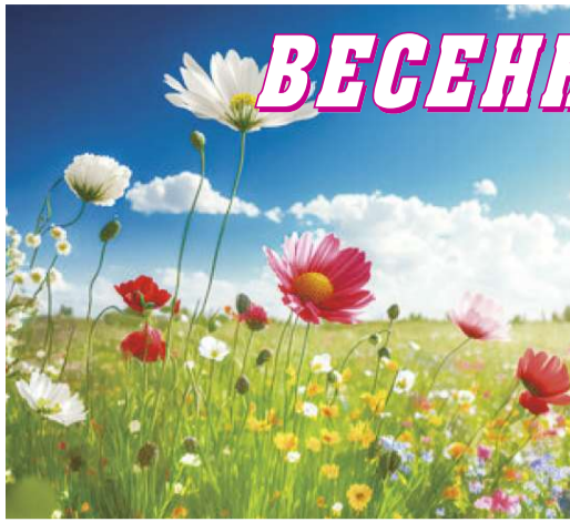
Ароматные цветы весны.