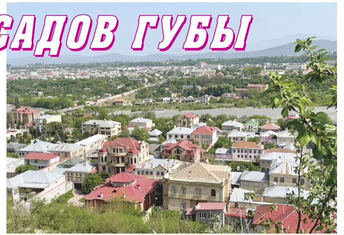
Всемирно известная Красная Слобода.